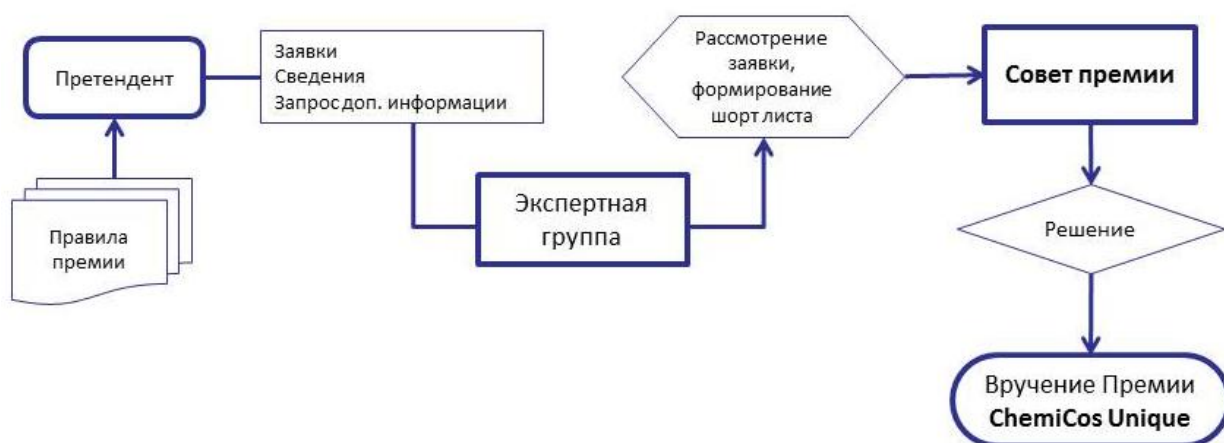
Рисунок 2. Общая схема рассмотрения заявок и определения победителей.